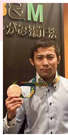
高藤直寿選手 (柔道)リオ五輪銅メダリスト

整骨院30院(京都・大阪・兵庫・東京)、社員200名以上を束ねるサンキューグループ代表。社員からの人望も厚く、理想の会社創りに本気で取り組んでいる。コンサルタントとしても大活躍で、業界内外に数多くのファンを持つ、京都の革命家。リーダーシップというモノの本質を知る本物の経営者。常に柔道整復師の未来のことを考え、実行する業界のエキスパートである。プロスポーツや芸能界などからの来院者も多く、「施術にエビデンスを持たせた日本初の柔道整復師」でもある。