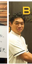
吉村真晴選手 (卓球)リオ五輪銀メダリスト