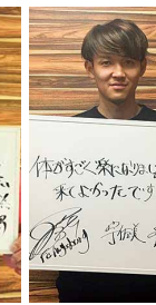
宇佐美貴史選手 (サッカー)日本代表